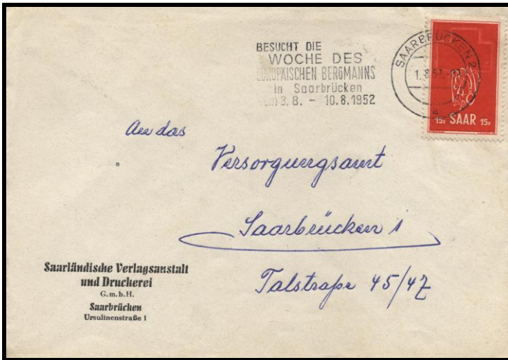
Inlandsbrief mit EF vom 01.08.1952 - Masch.-Stempel SAARBRÜCKEN 2 a „Besucht die Woche des europäischen Bergmanns in Saarbrücken ... 1952“