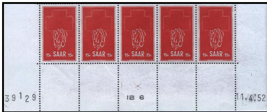
Druckdatum 11.4.52 mit richtig stehendem DMZ „I B 6“, Platte 0 (aus der 91.Steffen-Auktion)

Pies hatte wohl einen Bogen vom 12.04.1952, verfügte aber nicht über einen solchen vom 11.04.1952, der eine Aussage zum Beginn des Drucks an Maschine Nr. 6 hätte machen können. Bei der 91. Steffen-Auktion am 21.11.2009 in Saarbrücken war ein solcher Bogen im Angebot. Er beweist, dass bereits am 11.04.1952 an Maschine Nr. 6 gedruckt wurde.