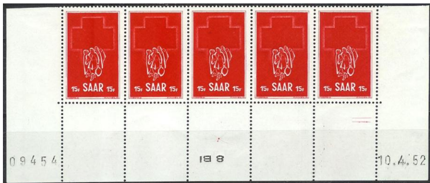
Druckdatum 10.4.52 mit kopfstehendem DMZ „I B 8“, Druck mit Platte 2 (Slg. Axel Braun)

„10. 4. 52“ am Bogenrand rechts unten mit der Maschine 8, der Druckvermerk „I B 8“ in der Mitte des Unterrandes ist umgekehrt („Kopfsteher“), die weiteren Druckdaten sind 11., 12., (13. und 14. Ostern), 15., 16. und 17./4. 1952, wobei der Druck mindestens vom 12.4. ab mit der Maschine 6 erfolgte (Druckvermerk „I B 6“, diesmal in richtiger Stellung).“