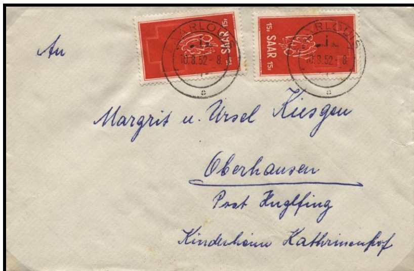
Brief vom 10.08.1952 nach DEUTSCHLAND mit 30 F (01.05.1951-14.07.1955) 2 x 15 F „Rotes Kreuz“ und 2KSt-Stempel „SAARLOUIS / i / 10.8.52 – 8“